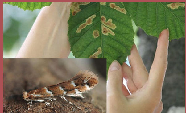
Рис. 2. Інвазивний вид амброзія полинолиста та шкідник мінуюча міль, що завдають значної шкоди рослинам Одеси.