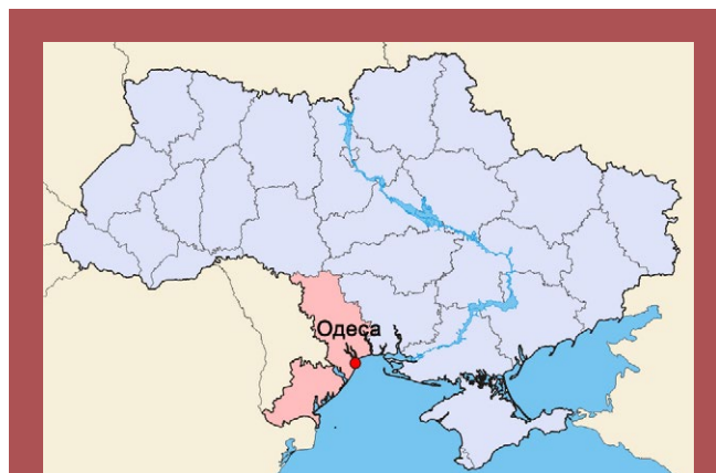
Рис. 1. Розташування Одеси на карті України [5].

Протягом останніх десятиліть клімат Одеси змінюється – наприклад, середньорічна температура повітря в Одесі за 2003–2013 рр. зросла на 1,4 °C (порівняно з кліматичною нормою) і становить 11,5 °C, зростання відбулося переважно за рахунок значного потепління в липні та серпні – на 1,9 та 2,0°C, відповідно, в той час як у лютому, вересні та жовтні температури підвищилися значно менше (в межах – 0,3–0,9°C). Відбулося зростання також і максимальних температур – в середньому на 1,4°C за рік. Найсуттєвішим їх зростання є у травні–серпні (від 2,0 до 2,8°C). Суттєво зросла середня кількість днів з темпера-